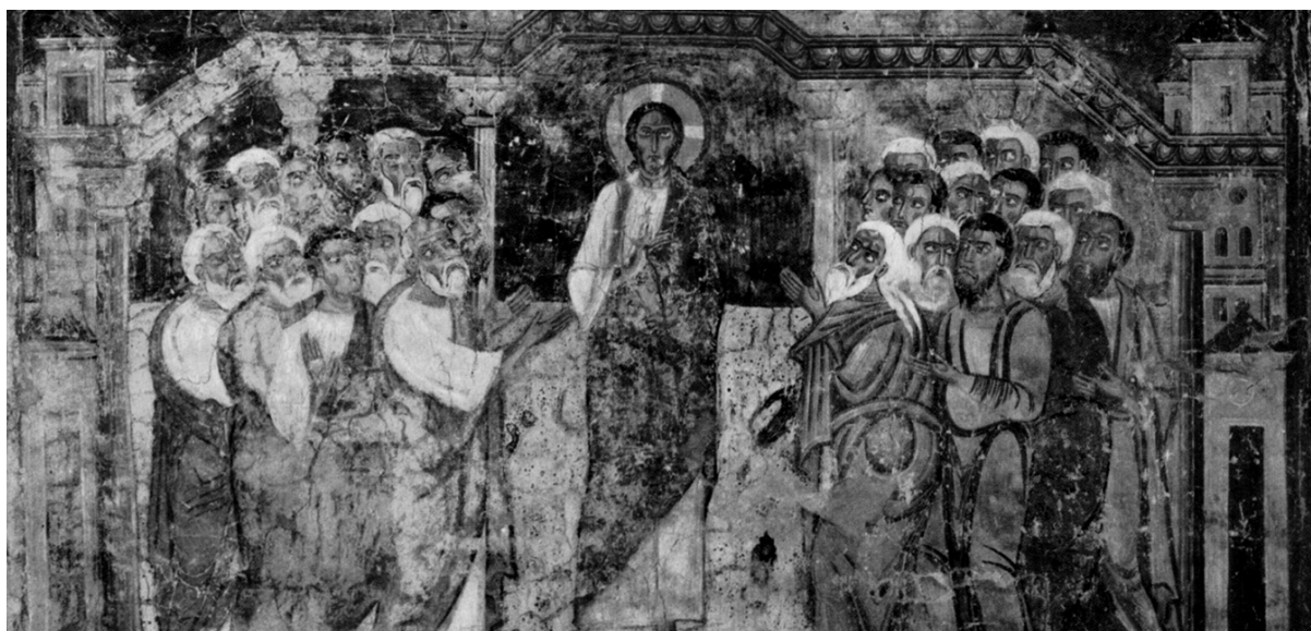
Stift Lambach, romanisches Fresko: Christus heilt einen Besessenen; aus: Lehr R. 2004: LandesChronik Oberösterreich. Wien.