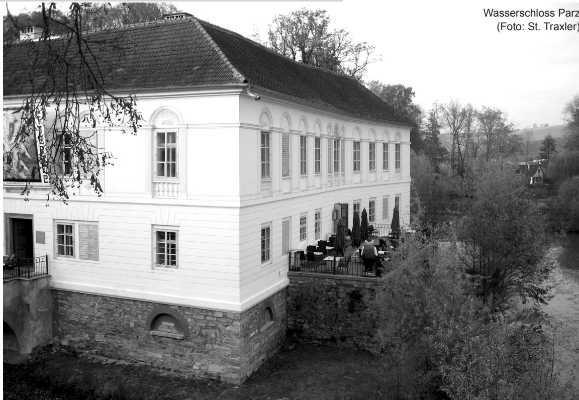
Wasserschloss Parz