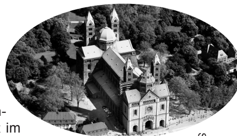
Speyerer Dom

Zwei großartige Ausstellungen, „Die Salier. Macht im Wandel“ und „Der Naumburger Meister. Bildhauer und Architekt im Europa der Kathedralen“ bilden Anfang und Abschluss einer Reise durch die Mitte Deutschlands vom Rhein zur Saale. Dabei fahren Sie durch romantische, von Weinbergen begleitete Flusstäler über die bewaldeten Höhen des deutschen Mittelgebirges bis zur lieblichen Talau der Saale. Sie besuchen Bischofs-, Königs- und Residenzstädte am Rhein und in Sachsen (Speyer, Heidelberg, Worms, Mainz, Wiesbaden, Naumburg, Zeitz, Zwickau) ebenso wie den römischen Limes (Saalburg), vorgeschichtliche Fundorte (Nebra, Goseck) und mittelalterliche Burgen, Pfalzen und Klöster (Limburg an der Haardt, Gelnhausen, Neuenburg, Stuhlpforte etc.). Zentral in den Städten gelegene qualitätsvolle Hotels ermöglichen auch Rundgänge bei nächtlicher Beleuchtung.