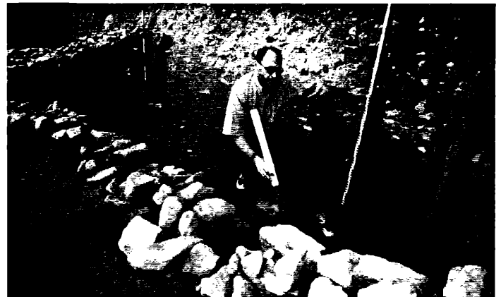
Der Fund barg eine archäologische Sensation: Eine 2.000 Jahre alte, trocken verlegte Mauer als Fundament einer Wallbefestigung.