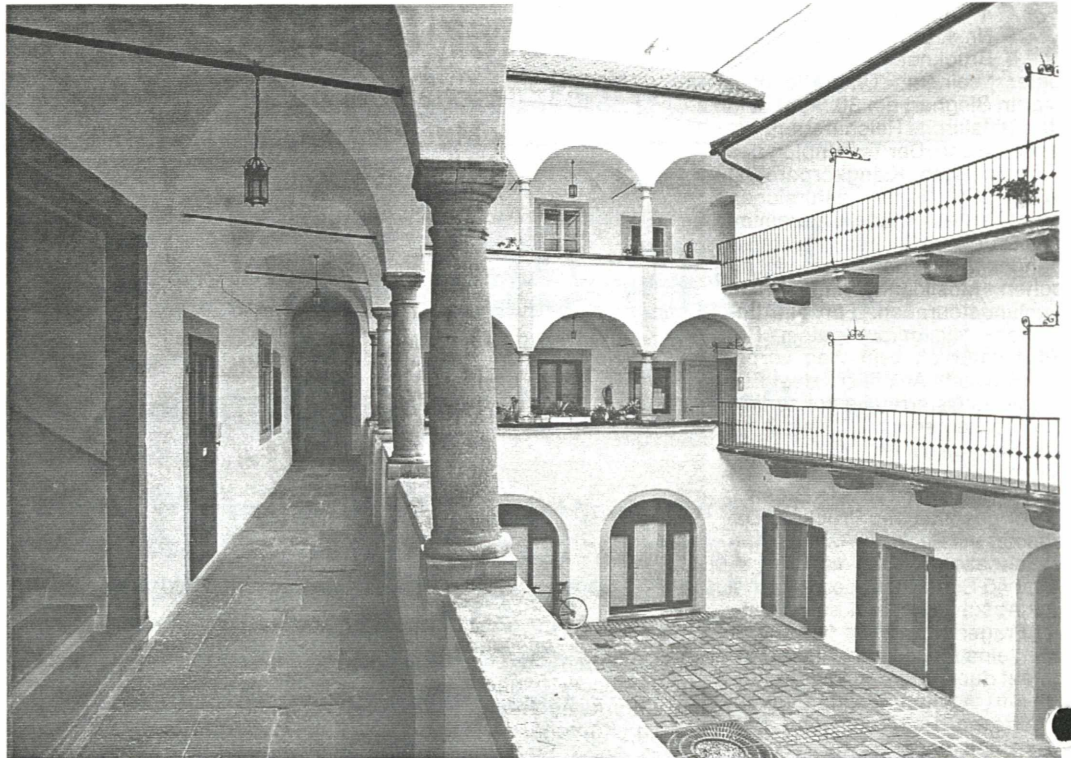
Der Arkadenhof des kürzlich sanierten Mozarthauses bietet stimmungsvolles Ambiente für kulturelle Veranstaltungen.

Um städtebaulich und architektonisch bedeutsame Gebäude zu erhalten, wurde 1978 im Rahmen der Linzer Bauverwaltung die Abteilung Altstadterhaltung des Planungsamtes eingerichtet. Gemeinsam mit der „Sachverständigenkommission Altstadterhaltung“ aus städtischen Beamten und beratenden Experten des