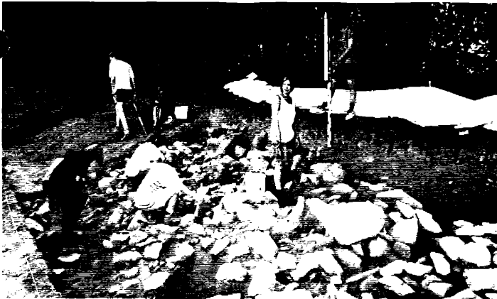
Nur das geschulte Auge des Archäologen kann die Bedeutung einer solchen Ansammlung von Steinen, wie hier am Gründberg, richtig erkennen.