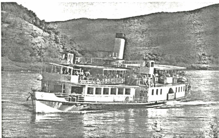
Voll besetzt und unter Volldampf pflügte die „Schönbrunn“ einst durch die Donauwellen, bis ihr ein unbarmherziges Geschick in Gestalt der DDSG-Liquidatoren den Garaus machen wollte.

Die „Schönbrunn“ wird als stolze Linzer Trophäe künftig als Gastronomie- und Ausflugsschiff eingesetzt, für Tagungen und Festakte zur Verfügung stehen und so das touristische Angebot von Linz um ein sehenswertes Schmuckstück bereichern.