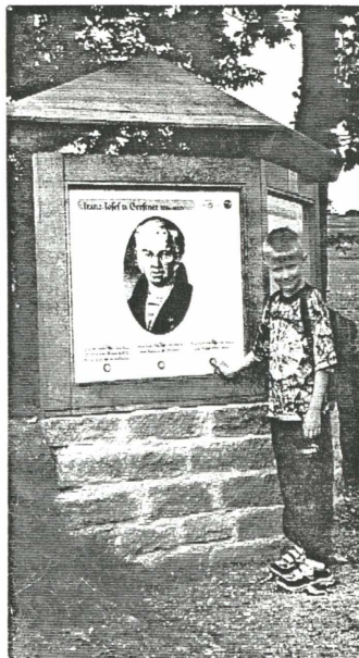
Franz Joseph Ritter von Gerstner, dem Linzer Eisenbahnkönig, wurde am Pferdeeisenbahn-Wanderweg eine Gedenktafel gewidmet.

Nähere Informationen: Tourismusregion Mühlviertel, 4020 Linz, Blütenstraße 8, Tel. 0732 / 735020.