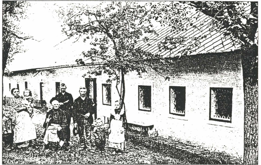
Stammsitz der Bruckner: Der Bruck-Hof (um 1900) bei Sindelburg

J nfolge nicht überprüfter mündlicher Traditionen und unzulänglicher Erhebungen herrschte in der Brucknerforschung lange Zeit die unzutreffende Ansicht, alle Vorfahren des großen Symphonikers seien seit jeher in Oberösterreich ansässig gewesen. Tatsächlich jedoch ist nur Anton Bruckners Vater im Land ober der Enns geboren, alle übrigen Ahnen väterlicherseits waren in ununterbrochener Reihe niederösterreichische Mostviertler. Sie lebten seit dem 15. Jahrhundert als Bauern, ab 1745 als Gewerbetreibende um Sindelburg bei Wallsee im heutigen Bezirk Amstetten. Diese Erkenntnis verdanken wir den akribischen genealogischen Forschungen Ernst Schwanzaras, der 1933 einen lückenlosen Bruckner-Stammbaum veröffentlichte.