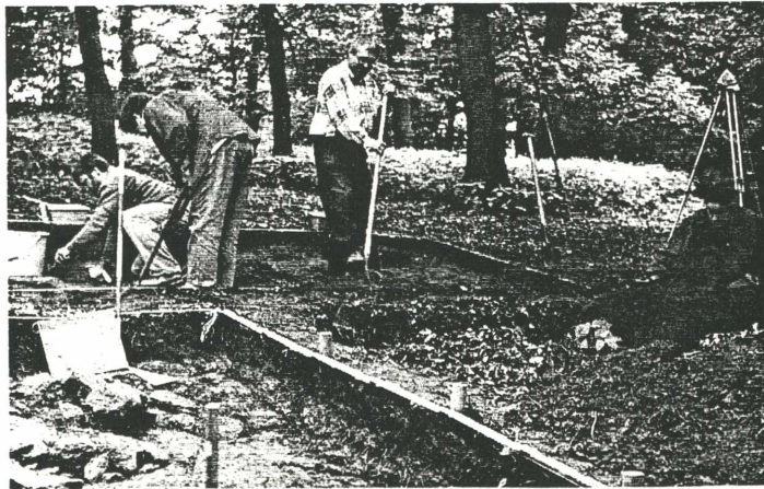
Durch Abtragen von Erde und verwittertem Granit bis zum gewachsenen Fels kommen bei den Ausgrabungsarbeiten in Pulgarn zahlreiche Funde zum Vorschein.

Nach Sondierungen in den Jahren 1994 und 1995 steht nun fest, daß hier eine kleine Siedlung der späten Jungsteinzeit (3000 vor Christus) bestand, deren Zentrum heuer geortet werden konnte. Die diesjährige Ausgrabung förderte zahlreiche Geräte und Gegenstände des Alltags zutage, welche von den steinzeitlichen Siedlern einst verwendet wurden. Schon jetzt wird der Archäologe mit einem reichhaltigen Spektrum ver-