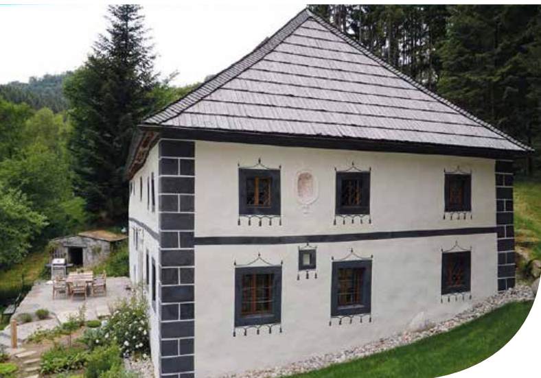
ABB. 2: RIEGLMÜHLE, WOHNHAUS NACH ERFOLGTER SANIERUNG

Nach dem Sichern wichtiger Mauerzüge wurde im gesamten Erdgeschoß der durchfeuchtete Boden ausgetauscht und drainagiert. Danach wurden Rollschotter, eine Bodenplatte und die Horizontalisolierung aufgebracht. Nach Abschluss der statischen Sicherungsarbeiten konnte mit der Instandsetzung des Dachstuhles die Restaurierung begonnen werden. Das stark beschädigte Dach war zu diesem Zeitpunkt mit Eternit-schindeln gedeckt. Diese wurden abgenommen, der Dachstuhl ausgebessert und das Dach mit Lärchenbrettern neu gedeckt. Vom Steinmauerwerk wurde der durchfeuchtete Lehmputz abge-