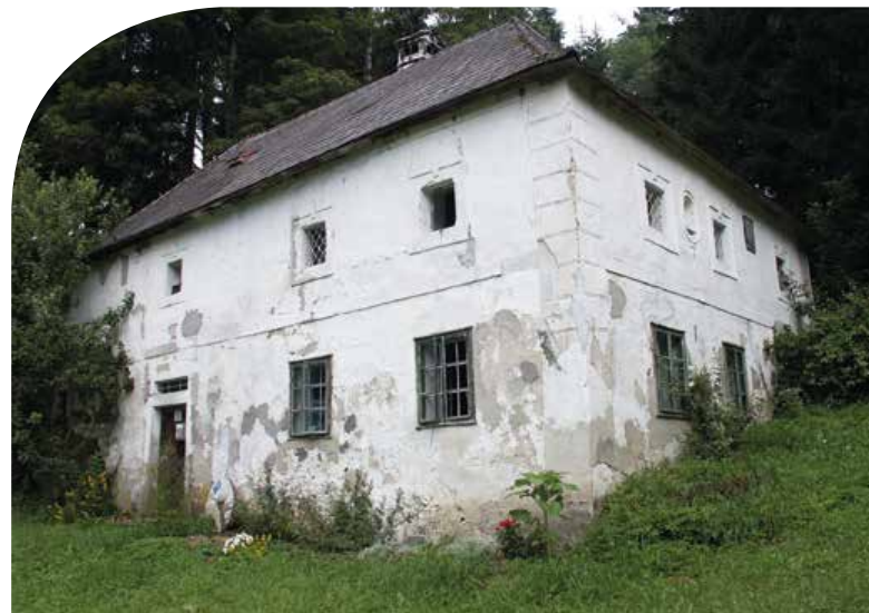
ABB. 1: RIEGLMÜHLE, WOHNHAUS VOR DER SANIERUNG

Die „Rieglmühle“ ist eine bemerkenswerte mehrteilige Gebäudegruppe. Das barocke Hauptgebäude, ein Wohnhaus mit Wasserrad, ist auf 1781 datiert. Das daneben liegende Wirtschaftsgebäude mit einem ehemals als Kuh- und Schweinestall genutzten Bereich stammt aus dem frühen 20. Jahrhundert. In einem Nebengebäude befinden sich eine Säge in Holzständerbauweise und, daran anschließend, eine Mühle mit zwei weiteren Wasserrädern. Ein tonnengewölbtes Backhaus und ein Erdkeller vervollständigen den Gebäudekomplex. Dass er dieses Baudenkmal retten wollte, wurde Michael Leimer bereits bei seinem ersten Besuch der Rieglmühle im Winter des Jahres 2005 klar.