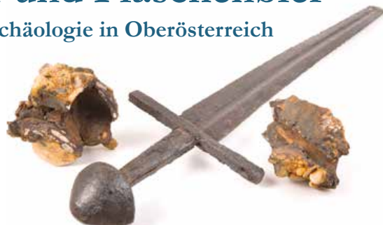
SCHWERT AUS DER KREUZRITTERZEIT UM 1200, GEFUNDEN IN DER DONAU BEI LINZ

NORDICO Stadtmuseum Linz Dametzstraße 23, 4020 Linz