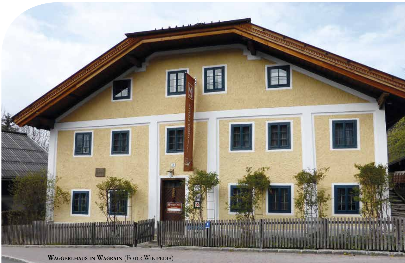
WAGGERLHAUS IN WAGRAIN

ANMELDUNG: Reisebüro Neubauer, siehe Seite 15