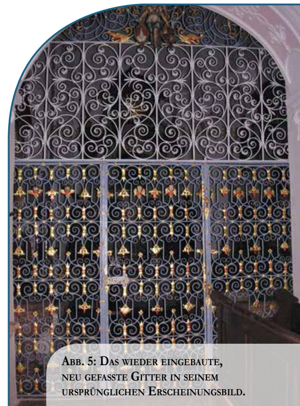
ABB. 5: DAS WIEDER EINGEBAUTE, NEU GEFASSTE GITTER IN SEINEM URSPRÜNGLICHEN ERSCHEINUNGSBILD.

Das neu gefasste Gitter wurde im September 2015 wieder in der Pfarrkirche Aurolzmünster montiert und strahlt dort in seinem ursprünglichen Erscheinungsbild (Abb. 5). Ohne die mutige Entscheidung und das hohe Engagement der Pfarre wäre es wohl nicht möglich gewesen, das Gitter in dieser Form zu restaurieren.