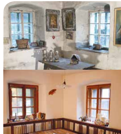
ABB. 3: STUBE IM WOHNHAUS VOR UND NACH DER RESTAURIERUNG

Besonders großer Wert wurde im Rahmen der Restaurierung auf die Erhaltung zahlreicher bau- und kulturhistorischer Details, etwa der Böden oder der Innentüren, gelegt (Abb. 3). So wurden alle Fensteröffnungen in ihrer Größe erhalten. Die alten Fensterstöcke und Fensterflügel wurden durch neue Holzkastenfenster aus Lärchenholz ersetzt. Beschläge und Fensterglas wurden von qualifizierten Werkstätten angefertigt und in die neuen Kastenfenster eingebaut. Alle Innentüren wurden ausgebaut, restauriert und in die bestehenden Türöffnungen wieder eingesetzt. In der Stube und der Küche wurde ein alter Holzbohlenboden mit geölter Oberfläche verlegt, in den weiteren Räumen des Wohngebäudes wurde ein neuer Lärchenschiffboden eingebaut. Für das Vorhaus wurde ein alter, handbekanteter Solnhofener Boden gewählt, Granitstufen führen zum Treppenhaus und in die Stube.