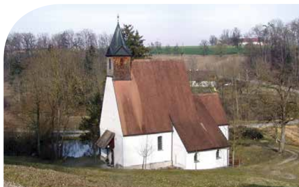
WALLFAHRTSKIRCHE ST. GEORGEN IM SCHAUERTAL

ANMELDUNG: Reisebüro Neubauer, siehe Seite 15