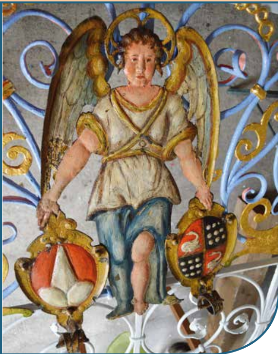
ABB. 3: AM OBEREN BOGENTEIL PRÄSENTIERT EIN ENGEL ZWEI WAPPENSCHILDER, DAS STAMMWAPPEN DER TANNBERGER UND DAS WAPPEN DER FAMILIE CLOSEN.

Der Engel war ursprünglich in Silber- und Goldluster gefasst, sein Gewand war nicht blau, sondern grün. Diese Fassung stammt aus der Zeit wohl um 1870–1900, sie wurde belassen. Blau war ein Zeichen von Reichtum, weil sehr teuer, auch der Engel ist aus einem einzigen Stück gemacht, was eher selten war. Ein Engel war nicht mehr vorhanden und musste von Restaurator Wolfgang Auer ergänzt werden. Ein zweiter war