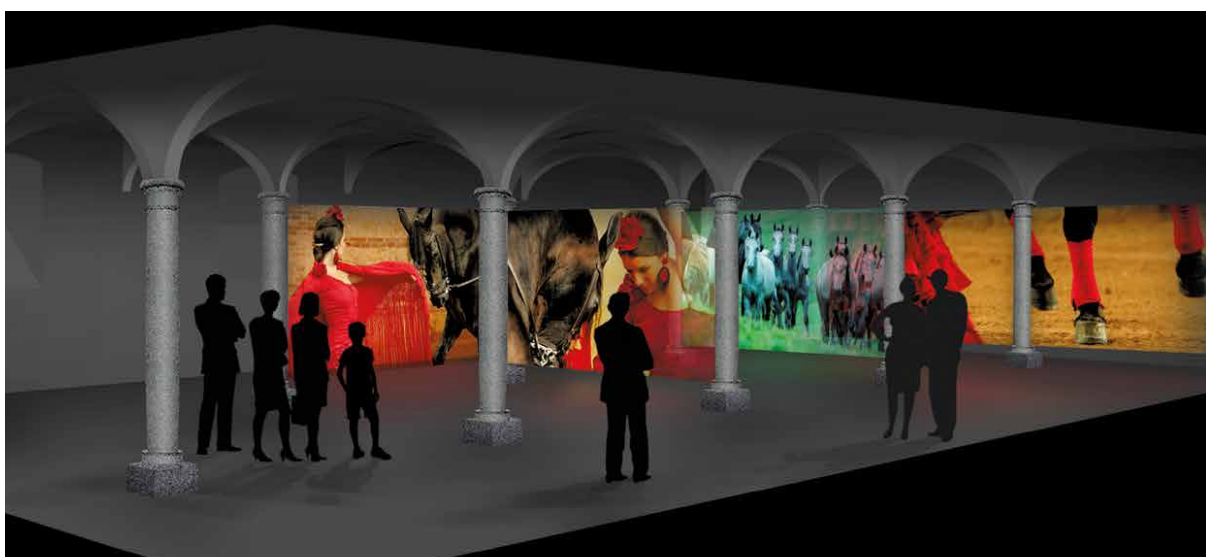
MULTIMEDIA-INSTALLATION IM ROSSSTALL LAMBACH

ANMELDUNG: Reisebüro Neubauer, siehe Seite 15