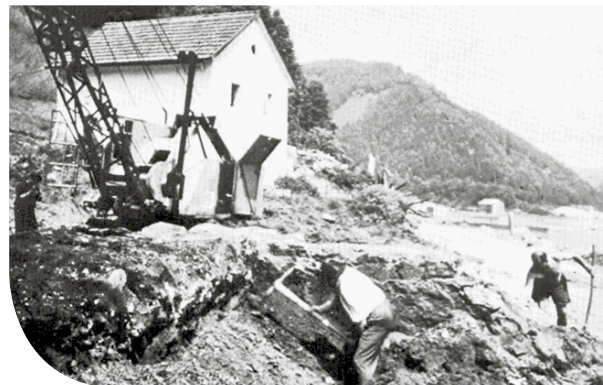
WACHTTURM WÄHREND DER ZERSTÖRUNG 1962

Umso trauriger ist die Geschichte des römischen burgus im sogenannten Roßgraben in Kobling: Bereits 1838 legte der Schlögener Ausgrabungsverein ein quadratisches Gebäude frei. Es handelte sich dabei um die frühesten archäologischen Grabungen in Oberösterreich und am gesamten österreichischen Limesabschnitt nach den im selben Jahr begonnenen Forschungen in Schlägen selbst. Der Turm, dessen quadratische Grundmauern acht Meter Seitenlänge aufwies, lag strategisch günstig gegenüber der Mündung der Kleinen Mühl.