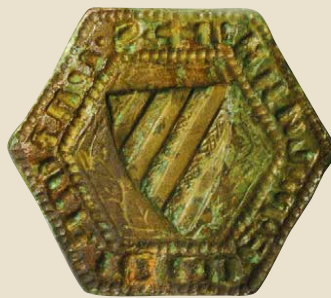
Abb. 1: DER SIEGELSTEMPEL IN RESTAURIERTEM ZUSTAND, ETWA NATÜRLICHE GRÖSSE

Der vorliegende Siegelstempel wurde im April 2015 als Zufallsfund entdeckt: Martin Waibel fand das Typar an der Oberfläche eines gepflügten Ackers, etwa einen Meter neben einem Schotterweg in der Ortschaft Rührndorf (Gemeinde Ried im Traunkreis). Die Fundstelle liegt in unmittelbarer Umgebung der abgegangenen Burg Rechberg (Rehberg).