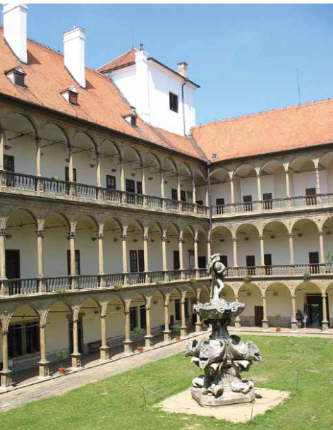
ARKADENHOF BUTSCHOWITZ

Brünn. Der zweite Tag beginnt mit einer Stadtführung durch Brünn. Anschließend erfolgt die Weiterreise über Tišnov/Tischnowitz nach Lysice. Dort genießen Sie eine Führung durch die Ausstellung „Marie von Ebner-Eschenbach“. Weiter führt Sie die Fahrt