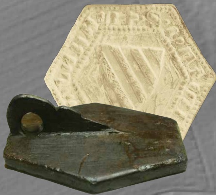
ZUM AUSSERGEWÖHNLICHEN FUND EINES SIEGELSTEMPELS AB SEITE 5