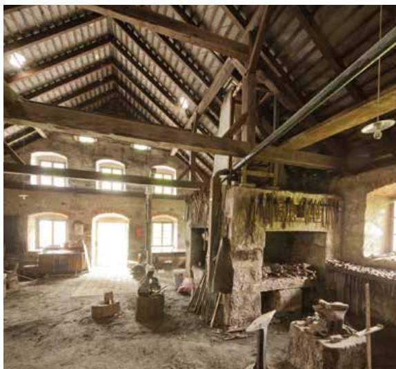
HISTORISCHE SCHMIEDE HOFWIESHAMMER, WINDHAAG BEI FREISTADT

„Feuer & Flamme“ lautet das Motto des diesjährigen „Tages des Denkmals“, der am 27. September vom Bundesdenkmalamt (BDA) in ganz Österreich veranstaltet wird. Rund 230 denkmalgeschützte Objekte – darunter Burgen, Schlösser, archäologische Grabungen, historische Siedlungen, originalerhaltene Handwerkstätten, technische Denkmale u.v.m. – öffnen bei freiem Eintritt ihre Tore und ermöglichen bei speziellen Programmpunkten und Führungen einen besonderen Blick auf unser kulturelles Erbe und traditionelle Kulturtechniken. Das detaillierte Programm ist ab sofort im Internet unter www.tagdesdenkmals.at abrufbar.