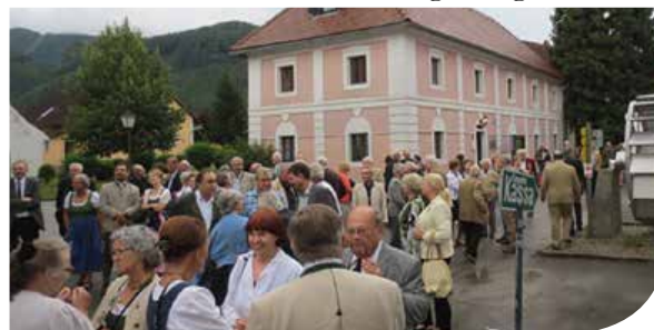
ABB. 4: GÄSTE DER FESTVERANSTALTUNG DER GLD AM 9. JULI 2015 IM SENSENSCHMIEDEMUSEUM MICHELDORF