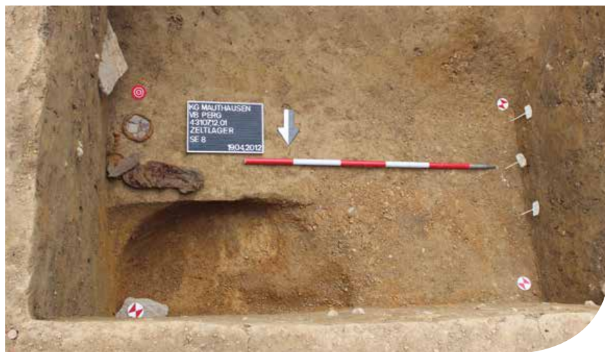
ABB. 2: BEFUNDSITUATION VON DER AUSGRABUNG IM ZELTLAGER IN MALTHAUSEN. DIE TERRASSIERUNGEN WAREN WESENTLICH STEILER ALS HEUTE, MIT HILFE VON DRAINAGEGRÄBCHEN VERSUCHTE MAN ZU VERHINDERN, DASS WASSER IN DIE ZELTE EINDRANG

sollte zudem noch der ehemalige Appellplatz gestaltet werden. Zuvor wurde der Bereich großflächig archäologisch freigelegt. Dabei konnten auch die Pfostenlöcher erkannt werden, die zum hölzernen Eingangstor gehören. Die Ausgrabungen haben also das Lager wieder sichtbar werden lassen und zentrale Punkte eines Gedenkens – Eingangsbereich, Umzäunung, Appellplatz – erforscht (Abb. 1). Die Ausgrabungen im Zeltlager in Mauthausen hatten ein anderes Ziel. Von Zeitzeugenberichten ist bekannt, dass die Verhältnisse im Zeltlager viel katastrophaler waren als im Hauptlager. Das Zeltlager war im Herbst 1944 eingerichtet worden, um unzählige Häftlinge, vornehmlich aus den östlichen (aufgegebenen) Lagern unterzubringen. Für die Anlage des Zeltlagers mussten die Häftlinge zunächst das Areal terrassieren, diese Geländeterrassen sind heute noch sichtbar, jedoch waren sie 1944/45 viel steiler als heute (Abb. 2). Bei den Ausgrabungen konnte das ehemalige Geländere Relief erkannt werden. Es zeigten sich außerdem kleine Drainage-