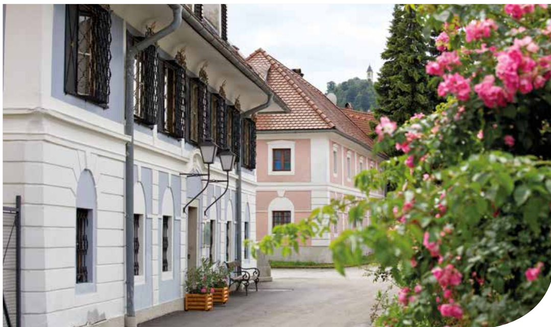
ABB. 3: DAS HERRENHAUS UND (DAHINTER) DAS SCHMIEDHAUS IM MICHELDORFER MUSEUMSKOMPLEX

werk erstmals im Jahr 1525. Die Anzahl an Sensenhämmern an den Wasserläufen von Krems, Alm und Steyr nahm stetig zu; der durch Wasserkraft angetriebene Schwanzhammer löste den Fausthammer ab, wodurch eine Verlagerung des Sensenschmiedehandwerks von der Stadt auf das Land erfolgte. Eine auf den Micheldorfer Eßmeister Konrad Eisvogel zurückgehende technische Innovation, nicht nur für die Herstellung des Sensenknüttels, sondern auch für das Breiten des Sensenblattes den wassergetriebenen Hammer anstelle des Fausthammers zu verwenden, löste im ausgehenden 16. Jahrhundert die bisherige Produktionsmethode ab. Konnten mit dem Fausthammer 13 bis 20 Sensen pro Tag erzeugt werden, so vermochte man mit wasserbetriebenen Zain- und Breithämmern bei verbesserter Qualität mindestens 70 Sensen täglich zu fertigen. 2 Mit dieser Innovation und verbunden mit der Einführung einer strikten Arbeitsteilung, entwickelte sich die Sensenerzeugung zum Großhandwerk. Die neue Herstellungsmethode – vom Zainen bis zur fertigen Sense den wassergetriebenen Hammer zu verwenden – führte zu einer gesteigerten Produktionstiefe, die Verpackung und Versand mit einschloss. Dieser arbeitsteilige Prozess war durch eine strenge Hierarchie an Arbeitskräften, an deren Spitze Eßmeister, Hammerschmied und Abrichter standen, geprägt. Die Qualität, das heißt die Güte der Erzeugnisse hing vom Können und der Tüchtigkeit des Eßmeisters ab und damit letztlich auch der Ruf der Werkstätte.