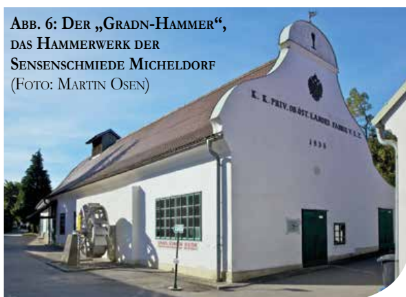
ABB. 6: DER „GRADN-HAMMER“, DAS HAMMERWERK DER SENSENSCHMIEDE MICHELDORF