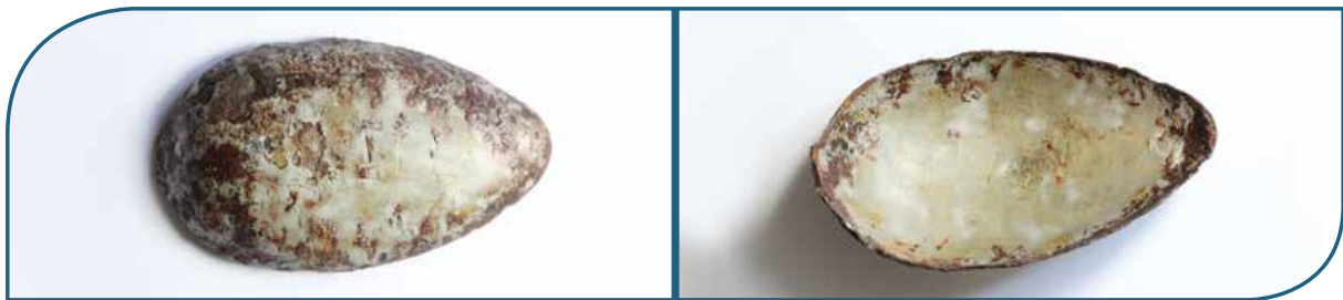
ABB. 3: LÖFFELLAFFE MIT DER BESCHRIFTUNG [...]AIEL 59164. AUF DIESE WEISE VERSUCHTE EIN HÄFTLING, SEIN EIGENTUM ZU MARKIEREN

kennzeichnen. So wurden vielfach Erkennungszeichen durch verschiedene Muster optisch ein wenig verschönert. Auf einer Löffellaffe, die am Loiblpass gefunden wurde, sind die Buchstaben [...]AIEL und die Ziffernfolge 59164 eingeritzt (Abb. 3). Letzteres wird eventuell die Häftlingsnummer sein, Ersteres Bestandteil des Namens. Hier besteht nun die Möglichkeit, weitere Informationen zu den Häftlingen zu eruieren. Die auf diese Weise personalisierten Objekte tragen somit dazu bei, etwas über die Menschen und ihre Versuche, ein wenig Menschenwürde zu bewahren, zu erfahren.