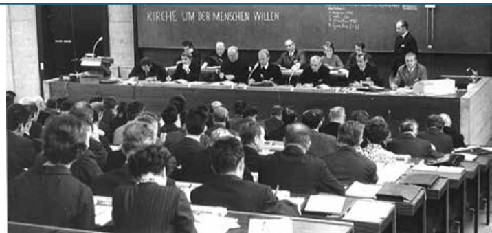
DIE VOLLVERSAMMLUNG DER LINZER DIÖZESANSYNODE 1970–1972

Der Verein für Linzer Diözesangeschichte veranstaltet das „3. Symposium zur Linzer Diözesangeschichte“, das sich in einem ersten Teil mit einem „Blick zurück nach vorn“ auf die Themenkreise „Konzil – Diözesansynode – Rezeption (1965/2015)“ konzentrieren wird. Auch ein Round Table-Gespräch mit Zeitzeugen der Linzer Diözesansynode 1970–1972 ist geplant. In einem zweiten, epochenübergreifenden Präsentationsteil wird wiederum eine Plattform für diözesan- bzw. kirchengeschichtliche Projekte, Forschungen und Aktivitäten geboten. Im Rahmen dieser Tagung wird auch die eben erschienene Publikation Monika Würthinger – Klaus Birngruber, Linzer Diözesangeschichte 1909–1918, hg. vom Diözesanarchiv Linz (NAGDL 20), Linz 2015, 274 Seiten, 153 Abb., Register