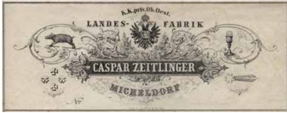
ABB. 5: BRIEFKOPF CASPAR ZEITLINGERS (LITHOGRAPHIE AUGUST RED, LINZ, VOR 1850) MARTIN OSEN, DER DIESES UND ZAHLREICHE WEITERE BILDER ZUR VERFÜGUNG STELLTE, SEI DAFÜR HERZLICH GEDANKT.