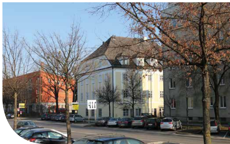
DAS ZWIRNERSTÖCKL, DAS LETZTE NOCH BESTEHENDE GEBÄUDE DES ENSEMBLES DER WOLLZEUGFABRIK

BILD: OBERÖSTERREICHISCHES LANDESMUSEUM, INV. NR. OA LI 31/3