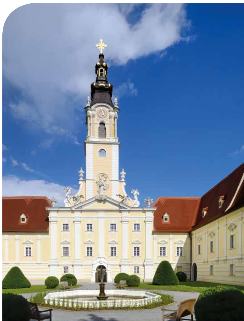
STIFTSKIRCHE UND INNENHOF DES BENEDIKTINERSTIFTS STIFT ALTENBURG

ANMELDUNG: Reisebüro Neubauer, siehe S. 15