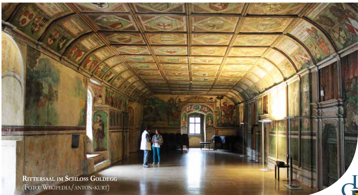
RITTERSAL IM SCHLOSS GOLDEGG

ANMELDUNG: Reisebüro Neubauer, siehe Seite 15