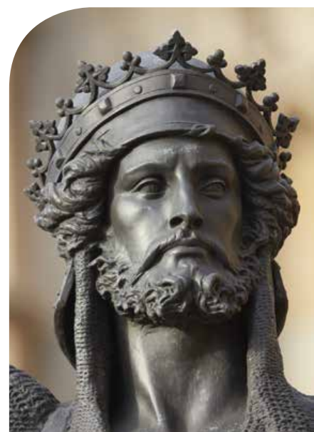
RICHARD LÖWENHERZ. REITERSTANDBILD VON BARON CARLO MAROCCHETTI, 1860, LONDON

ANMELDUNG: Reisebüro Neubauer, siehe Seite 15