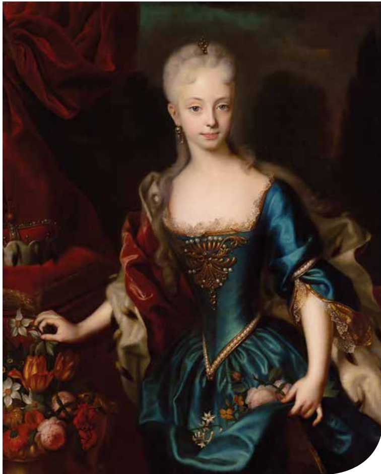
MARIA THERESA ALS JUNGE ERZHERZOGIN